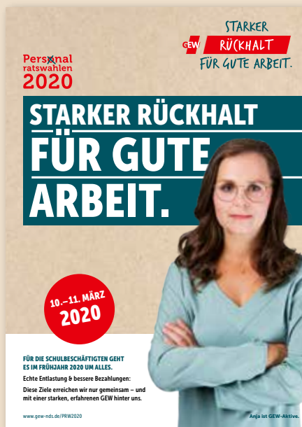
Das Kampagnenplakat für eine einheitliche und starke Kommunikation

Unsere Wahlkampfmechanik in der Zeit zwischen der Landesdelegiertenkonferenz und dem 10./11. März 2020, den Tagen der Personalratswahlen, ist geprägt vom Engagement einer starken GEW in Niedersachsen. Mit Aktionen vor Ort wollen wir das zum Ausdruck bringen.