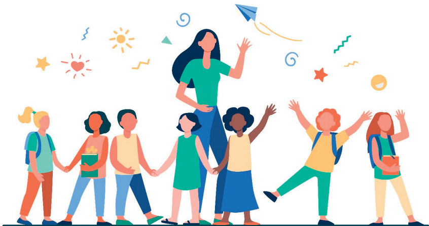
Bild: „Freepik.com“. Dieses Bild wurde mit Ressourcen von Freepik.com erstellt.