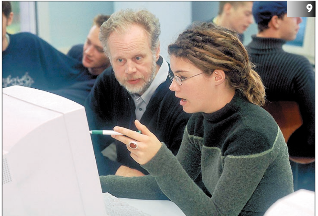
Der Verordnungsentwurf für die Sek II liegt vor. Das Pauken wird wieder im Vordergrund stehen: noch mehr Fächer, noch mehr Klausuren, noch weniger Zeit für projektartiges Lernen.