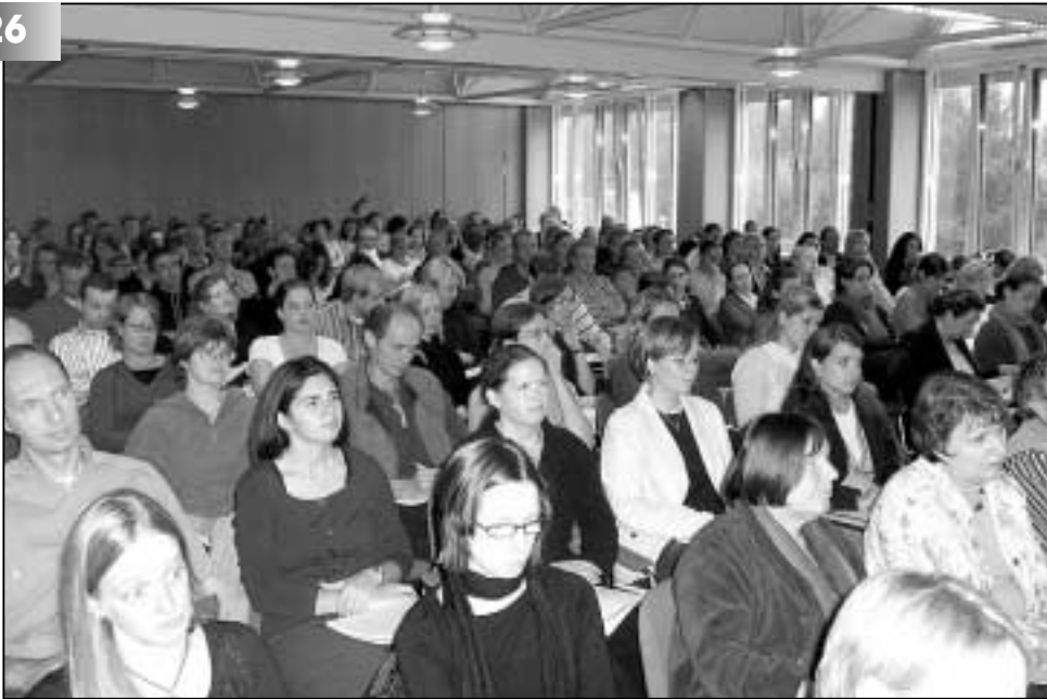
Positives Feedback. Der 1. Seminartag des GEW-Bezirksverbandes Lüneburg – Thema „Gestörte Schüler – verstörte Lehrkräfte“ – stieß auf große Resonanz.