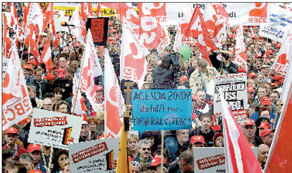
Die Gewerkschaften machen mobil gegen den Sozialabbau durch die Bundesregierung. Hunderttausende nahmen am 3. April an den Demonstrationen des DGB in Berlin, Köln und Stuttgart teil.

Terminologische Änderungen gibt es ferner im Zusammenhang mit der bisherigen Bezeichnung einzelner Förderschulformen (z.B. Schule für geistig Behinderte, Schule für Körperbehinderte). Die Verabsolutierung des Menschen durch das Adjektiv „behindert“ werde, so die Gesetzesbegründung, als diskriminierend empfunden. Im Sprachgebrauch setze sich gegenwärtig die Bezeichnung „Mensch mit Behinderungen“ (statt: „behinderter Mensch“) durch. Dementsprechend