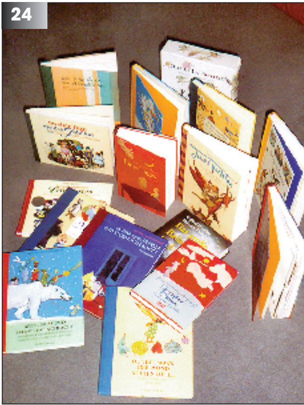
Wunderschöne Bücher zum Anschauen, Lesen und Vorlesen. Eigentlich gehörte eine Auswahl in jeden Klassenraum der GS. Zumindest in der Schulbücherei sollten für Lehrer und Kinder viele dieser Schätze vorhanden sein.

Vorlesebücher, die den Blick auf die Illustration richten. In ähnlicher Aufmachung mit vielen Bildern hat der traditionelle Verlag Esslinger Märchen und Geschichten herausgegeben. Man fragt sich: Was sollte bei Hausbüchern dominieren, Text oder Bild?