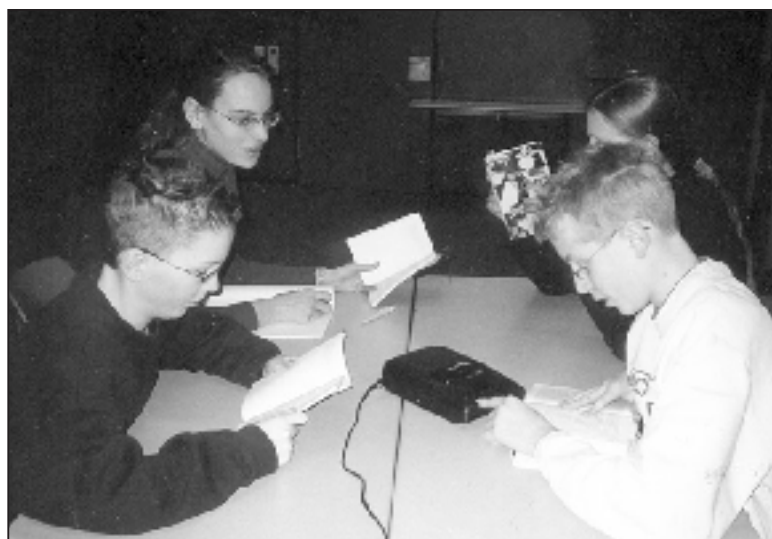
Bücher zum Hören selbst herstellen. Jungen und Mädchen lesen Bücher nach ihrer Wahl. Spannende, witzige Passagen werden markiert und auf Kassette gesprochen. So entstehen „Bücher zum Hören“.

Der amerikanische Autor Sachar – sein Jugendbuch „Löcher“ stand auf der Aus-