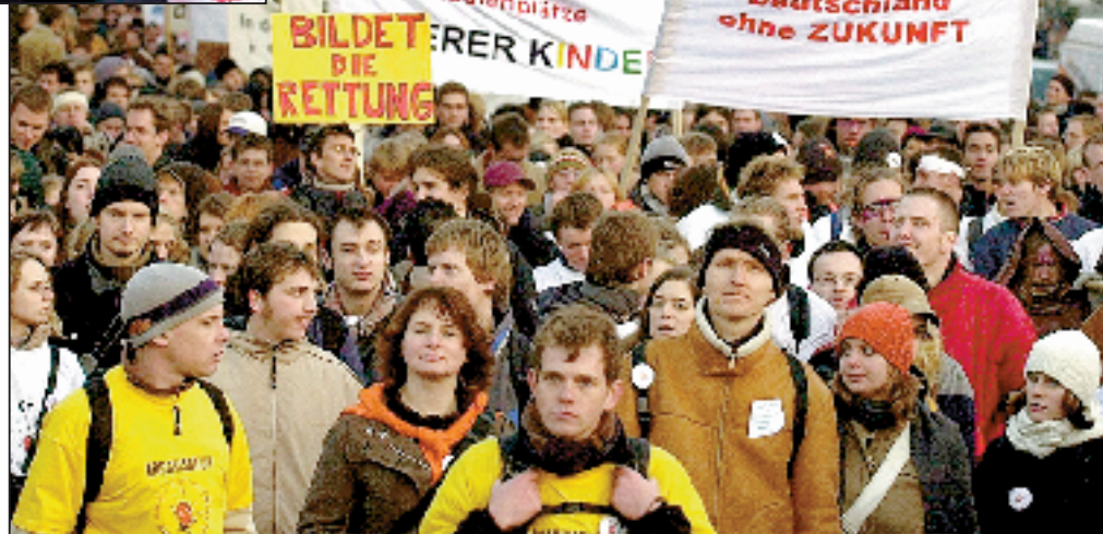
Landesregierung löst wachsenden Unmut aus. Die massiven Eingriffe in Struktur und Ausstattung des niedersächsischen Bildungswesens von der Kita bis zur Hochschule werden zunehmend zum Ärgernis für alle von Bildung Betroffenen. Der Widerstand beginnt sich zu organisieren.

Neu wird sein, dass ab August 2004 die Lernmittelfreiheit abgeschafft wird. Das Land spart dadurch 9,7 Millionen Euro.