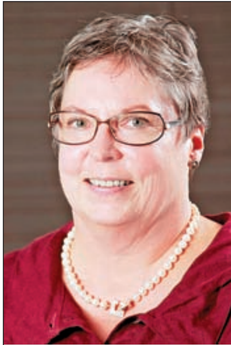
Christa Reichwald, Bildungspolitische Sprecherin der Fraktion Die LINKE im Niedersächsischen Landtag

Als Konsequenz daraus werden Kinder mit entsprechenden Leistungen gleich an Gymnasien angemeldet werden. Schließlich wollen die Eltern vermeiden, dass ihr Kind beim Übergang in die Oberstufe noch einmal die