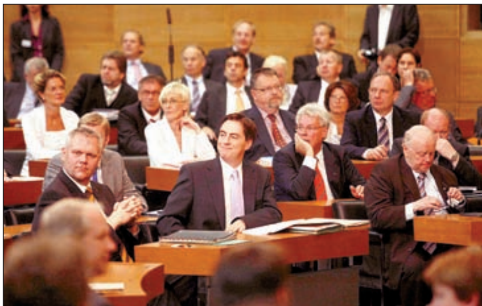
Die Landesregierung sollte auf den letzten Metern nicht die Chance vergeben, doch noch einen Konsens zu erreichen. Eine entscheidende Rolle könnte dabei Ministerpräsident David McAllister zukommen – auf unserem Foto inmitten der CDU-Landtagsfraktion.

Diese Chance hat der Kultusminister bisher nicht genutzt, auch wenn sie ihn erkennbar gereizt hätte. Er konnte sich nicht durchsetzen. Die Koalition wollte lieber Streit statt Konsens. Dem Ministerpräsidenten war die Befindlichkeit des kleinen Koalitionspartners wichtiger. Und politische Beobachter fragen sich, ob der Minister inzwischen selbst für eine Verschärfung der Debatte sorgen will,