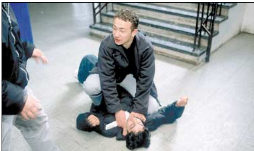
Prügelei im Schulgebäude. Den Schulen steht mit dem Schulrecht ein wirksames Instrument zur Verfügung, um zügig und angemessen auf Gewalt zu reagieren.

In der Diskussion über die Zunahme der Gewalt an Schulen, wird immer wieder behauptet, der Schule ständen keine wirksamen Mittel gegen gewalttätige Schülerinnen und Schüler zur Verfügung. Damit wird häufig die Forderung verbunden, durch Änderung der bestehenden Rechts- und Verwaltungsvorschriften den Schulen stärkere Eingriffsmöglichkeiten in die Hand zu geben. Im folgenden Beitrag wird dargestellt, was Schule in dieser Situation tun kann.