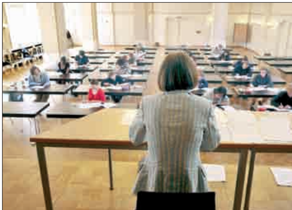
Das Abitur muss nun auch an Gesamtschulen nach zwölf Schuljahren abgelegt werden. Der Landtag hat die heftig umstrittene Schulgesetznovelle beschlossen.