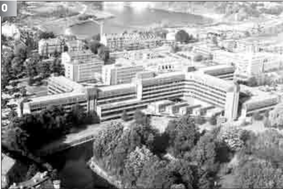
Seit mehreren Jahren steht eine Schulverwaltungsreform mit dem Aufbau einer leistungsfähigen Landesschulbehörde mit Zentrale in Lüneburg an. Doch die Kultusminister Busemann und Heister-Neumann haben nichts voran gebracht. Auf unserem Foto die Landesschulbehörde Lüneburg.