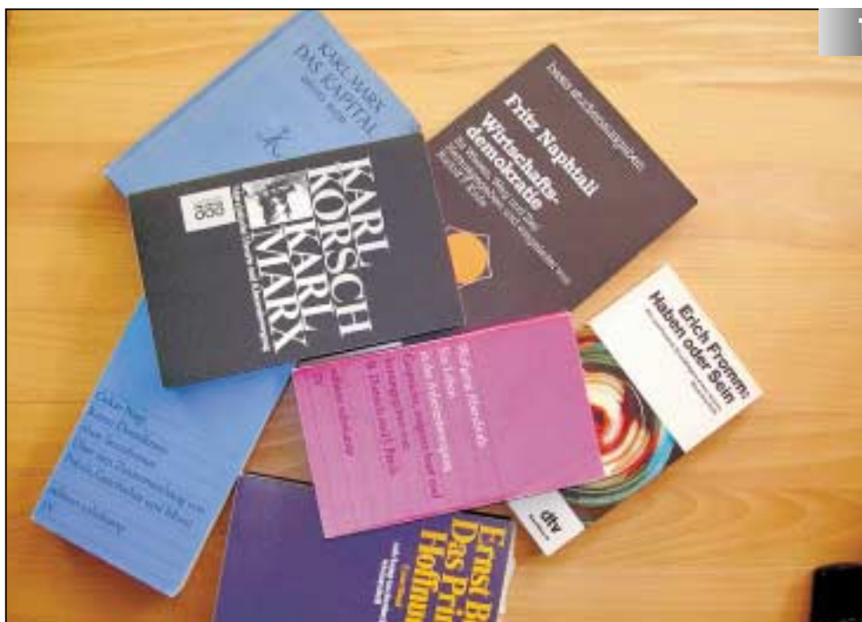
Macht sich künftig verdächtig, wer so etwas liest oder gar für wertvolle Beiträge zu unserer politischen Kultur hält? Manche Politikeräußerungen sprechen dafür.

Gäbe es etwa eine Volksabstimmung zum wirtschafts- und militärpolitisch brisanten „EU-Reformvertrag“, läge Irland politisch vermutlich näher an Deutschland als geografisch. Die Mehrheit der Bevölkerung hat längst genug von der fortwährenden Umverteilung von unten nach oben, von explodierenden Managergehältern bei anhaltender Massenarbeitslosigkeit,