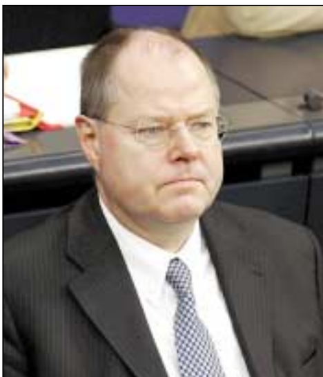
Bringt seine Mitarbeiter auf Trab. Finanzminister Peer Steinbrück.

„Allianz mit Rekordgewinn“ – „BASF-Zahlen überzeugen“ – „Für Conti läuft es bestens.“ Tolle Stimmung erfasst die DAX-Vorstände. Selbst der deutsche Mittelstand erfreut sich wieder, wie es heißt, exzellenter Geschäftsaussichten. Aber all das reicht noch nicht, sagt Bundesfinanzminister Peer Steinbrück und bringt seine Mitarbeiter auf Trab. Fleißig haben sie gearbeitet und ein 156 Seiten starkes Papier verfasst, das man Gesetz zur dauerhaften Aufstockung hoher und höchster Einkommen nennen könnte. Dieser Titel wäre allerdings nicht populär – weder beim Wahlvolk noch in der SPD. Deshalb braucht die Kommandoaktion eine neutrale Verpackung, ohne Glanz und Glamour. Und einen Namen, der keinen Argwohn weckt. Zum Beispiel „Unternehmenssteuerreform 2008“.