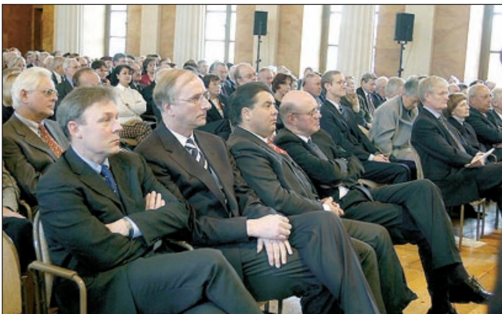
Feierlicher Festakt: Anlässlich der Umwidmung in Stiftungshochschulen kam in den betroffenen Universitäten Prominenz aus allen gesellschaftlichen Bereichen zusammen. Auf unserem Foto der Festakt in der Uni Göttingen mit dem noch amtierenden Ministerpräsidenten Sigmar Gabriel und seinem Wissenschaftsminister Thomas Oppermann.