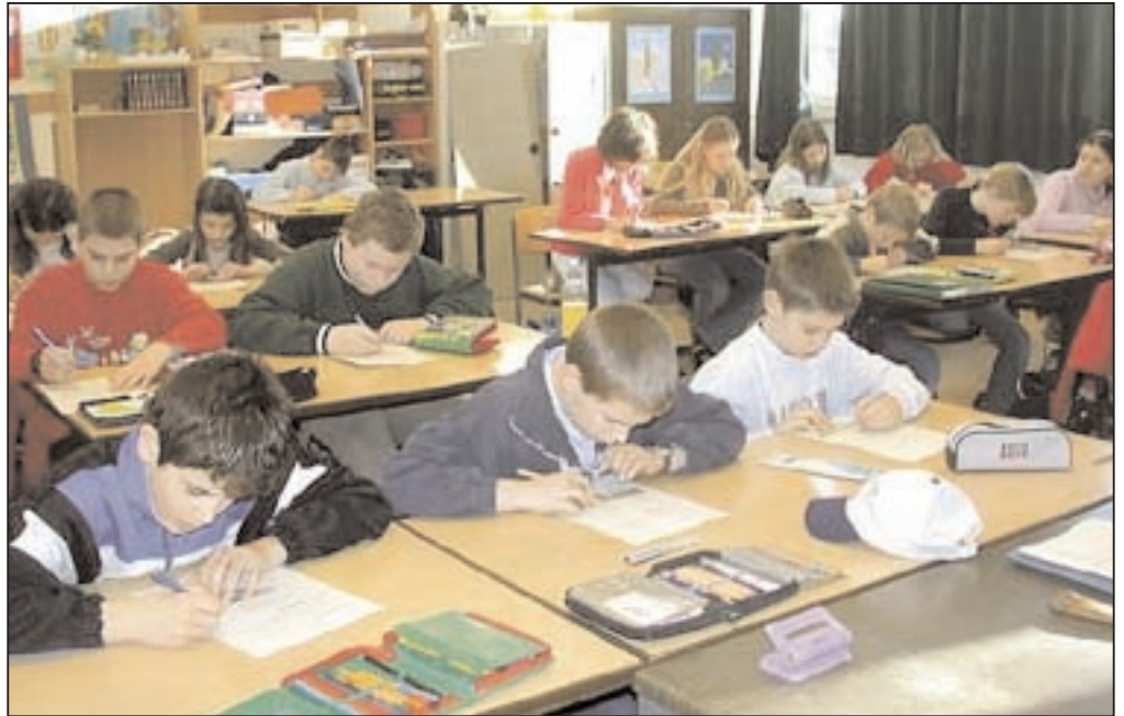
Das neue Schulgesetz wird die Schullandschaft verändern. Einzelheiten werden durch Verordnungen geregelt, die im MK erarbeitet werden. Abschluss- und andere Prüfungen werden einen neuen Stellenwert erhalten.

Beim Übergang von der Hauptschule zum Gymnasium sieht der Verordnungsentwurf entsprechend verschärfte Voraussetzungen vor, wobei unklar bleibt, wie an der Hauptschule in einer zweiten Fremdsprache die Note „gut“ erreicht werden kann, wenn ein solches Fremdsprachenangebot (jedenfalls bisher) nicht unterbreitet wird. Ob von der Berechtigung zum Schulform-