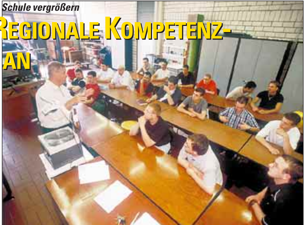
Zehn Modellschulen aus dem berufsbildenden Bereich sollen ProReKo erproben. Der Schulversuch ist auf fünf Jahre befristet.

Vor fast genau einem Jahr, am 17. September 2001, ist der Niedersächsische Landtag einstimmig der Beschlussempfehlung des Kultusausschusses gefolgt und hat die Landesregierung beauftragt, einen fünfjährigen Schulversuch „Berufsbildende Schulen in Niedersachsen als regionale Kompetenzzentren“ zu konzipieren. Das Kultusministerium hat daraufhin eine Projektbeschreibung „ProReKo – Projekt Regionale Kompetenzzentren“ im Juni 2002 vorgelegt. Am 8. August 2002 wurde der Ausschreibungstext für die Schulen veröffentlicht. Bis zum 31. Oktober 2002 können sich alle öffentlichen berufsbildenden Schulen des Landes für eine Teilnahme bewerben. Die Auswahl der bis zu zehn Schulen soll bis Mitte November 2002 abgeschlossen sein. Ebenfalls im November 2002 soll ein sogenannter „Start-up-Workshop“ mit den beteiligten Schulen stattfinden. Am 1. Januar 2003 beginnt dann offiziell der eigentliche Schulversuch und läuft wie gesagt fünf Jahre. Auftraggeberin ist die Ministerin, die Projektleitung liegt beim Abteilungsleiter der Abteilung Berufliche Bildung des MK.