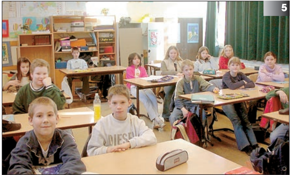
Erfolgreiche Länder fallen auf durch eine möglichst lange gemeinsame Schulzeit. In Niedersachsen fährt der Zug jetzt in eine andere Richtung. Die OS als integratives System wird abgeschafft.

Es ist gleichsam die „zweite, völlig überarbeitete und verbesserte (?) Auflage“ des „Gesetzes zur Verbesserung von Bildungsqualität und zur Sicherung von Schulstandorten“, das die Fraktionen der CDU und der FDP gemeinsam in den Landtag eingebracht haben. Die Anlehnung an den Entwurf der CDU vom Dezember letzten Jahres ist deutlich erkennbar; liberale Akzente sucht man vergebens. Insbesondere in der geplanten Abschaffung der Gesamtschule hat sich die sonst auf Wettbewerb und Vielfalt setzende FDP nicht durchsetzen mögen. Nach dem Fahrplan der Gesetzesberatung sollen Anfang Mai die Verbände und Organisationen angehört und die Ausschussberatungen so rechtzeitig abgeschlossen werden, dass der Gesetzentwurf im letzten Landtagsplenum vor der Sommerpause verabschiedet werden kann.