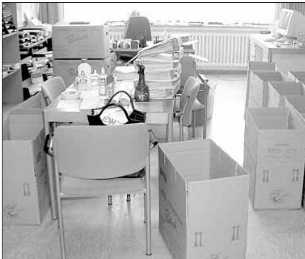
Schulen vor dem Umzug? Die Abschaffung der OS und die Einrichtung von Förderstufen, aber auch die Zusammenlegung von Haupt- und Realschulen wird unvermeidbar räumliche Konsequenzen haben. Da ist so mancher Umzug einzuplanen und mancher Karton zu packen.

• Der Niedersächsische Städtetag stellt heraus, dass ein verstärkter Wettbewerb unter