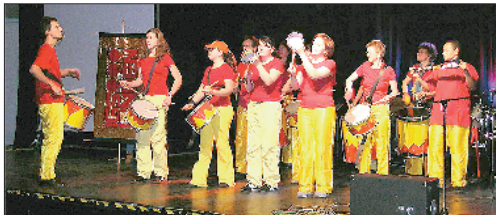
Schülerinnen der IGS Vahrenheide zeigten mitreißenden Jazzdance bei der Veranstaltung der sieben Integrierten Gesamtschulen aus Hannover im Raschplatzpavillon. „Gesamtschulen präsentieren ihr Können“, unter diesem Motto hatten die SchulleiterInnen eingeladen. Sie wollten zeigen, dass strukturierten Ganztagskonzepte erhalten bleiben müssen. Ihr Anliegen wurde von den bildungspolitischen Sprechern von SPD und Grünen, vom Landeselterrat, der GEW und etlichen Vertretern örtlicher Betriebe als Kooperationspartnern unterstützt.

Wer sich die Verfahrensvorschriften, die in den Ergänzenden Bestimmungen festge-