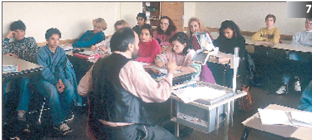
Das Gymnasium wird abgeschottet. Der Erlassentwurf zur Sekundarstufe I des Gymnasiums zementiert die Trennung der Schulformen. In Zukunft dürfte es kaum mehr möglich sein, von einer Real- oder Hauptschule auf das Gymnasium zu wechseln. Foto: Manfred Vollmer

Unser Dank gilt außerdem allen Kolleginnen und Kollegen, deren Mitgliedschaft sich in diesem Monat zu einem weiteren Jahr rundet.