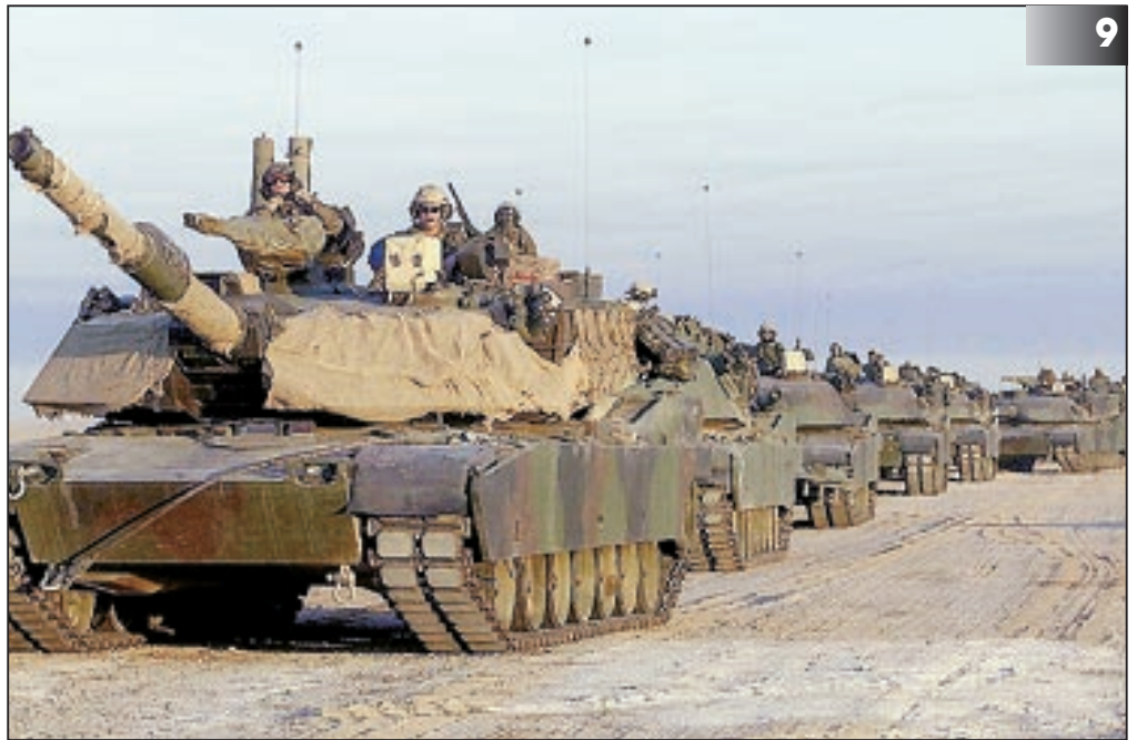
Der Krieg gegen den Irak scheint nur noch eine Frage von Tagen zu sein. Auch ohne Zustimmung des Uno-Sicherheitsrats wird Washington den Befehl zum Angriff geben.

Mit den bisher anerkannten – wenn auch keineswegs immer eingehaltenen – Regeln des Völkerrechts, etwa der Charta der Vereinten Nationen, ist diese neue Doktrin nicht vereinbar, auch nicht mit dem bisherigen völkerrechtlichen Verständnis von einem legiti-