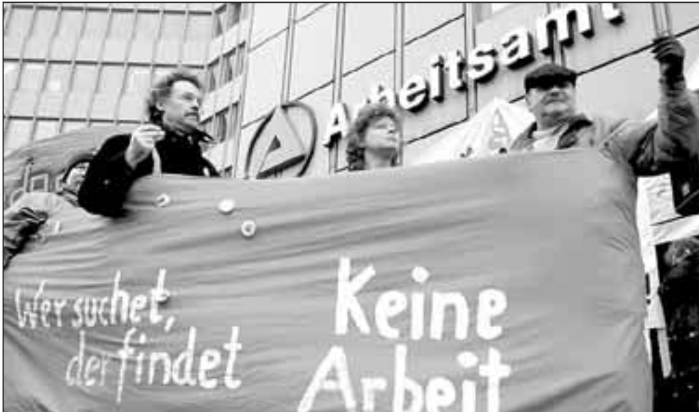
Arbeitslosigkeit abbauen – aber mit welchen Instrumenten? Die Projektgruppe Wissenstransfer hat die Vorschläge der Hartz-Kommission unter die Lupe genommen.

Die Hartz-Kommission hat einen „Masterplan“ zur Bekämpfung der Massenarbeitslosigkeit in Deutschland vorgelegt. Durch eine Beschleunigung der Arbeitsvermittlung sowie die Ausweitung von Leiharbeit, Mini-Jobs und neuer Selbstständigkeit soll die Arbeitslosigkeit in drei Jahren halbiert werden.