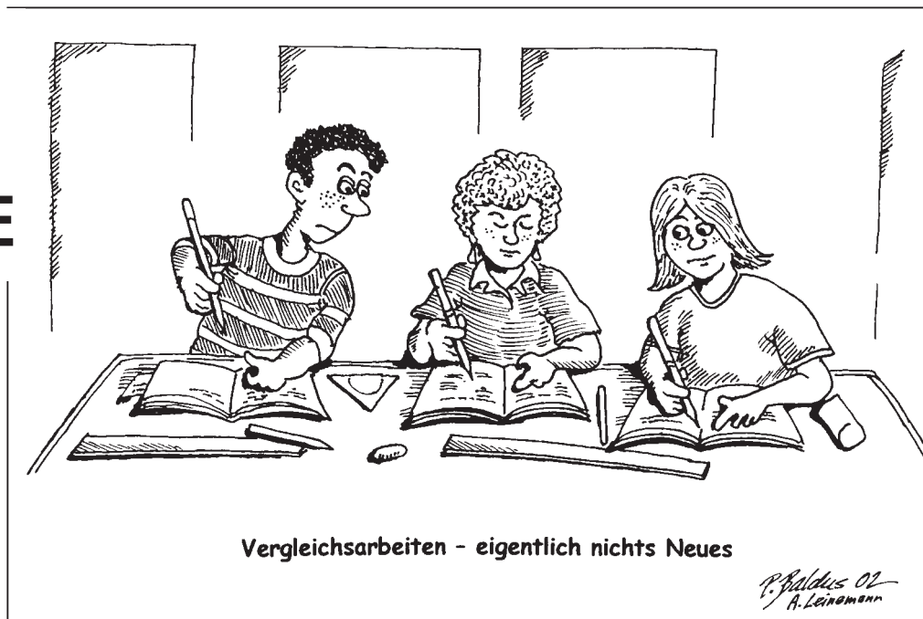
Vergleichsarbeiten - eigentlich nichts Neues

Geklärt werden soll durch diese Maßnahme auch, welche Leistungen Schülerinnen und Schüler des achten Schuljahrganges in den verschiedenen Bildungsgängen erbringen. Zugleich wird angestrebt, das Erreichen bestimmter Ziele über eine Schule hinaus zu verfolgen und durch die