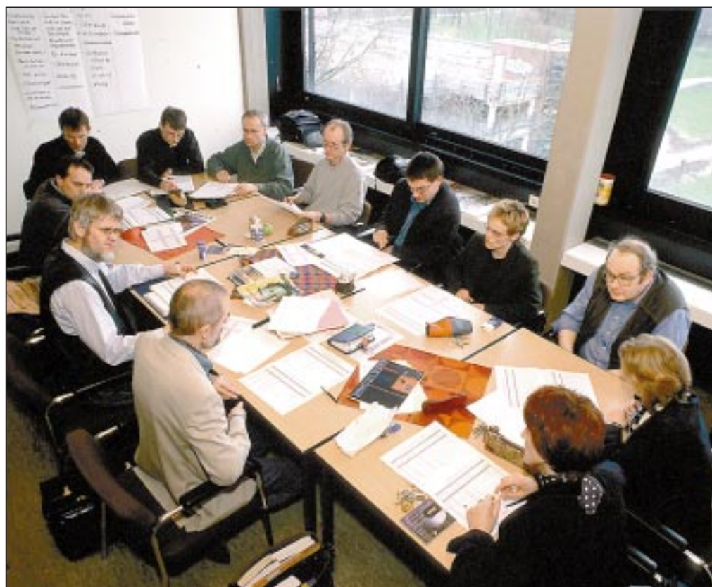
Die niedersächsischen Schulen, ihre Kollegien und Schulleitungen, stehen vor radikalen Änderungen, wenn es nach dem Willen von Ministerpräsident Gabriel (SPD) geht. Innerhalb von zehn Jahren sollen alle Schulen das Prädikat „Selbstständige Schule“ tragen und quasi wie Unternehmen organisiert werden.

Parallel zur Einrichtung der ersten „Selbstständigen Schulen“ werden wesentliche Elemente der Qualitätssicherung für alle Schulen einge-