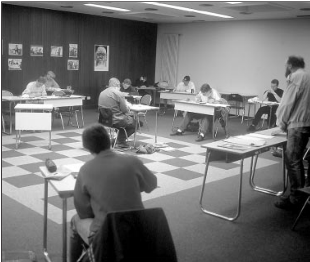
Abiturprüfung an einem Gymnasium. Künftig sollen die Aufgaben zentral vorgegeben werden.

Die Erfahrungen in diesen Ländern zeigen, dass das Zentralabitur nicht nur an sich als Prüfungsform problematisch ist, sondern zudem erhebliche negative Rückwirkungen auf den Unterricht in der gymnasialen Oberstufe hat.