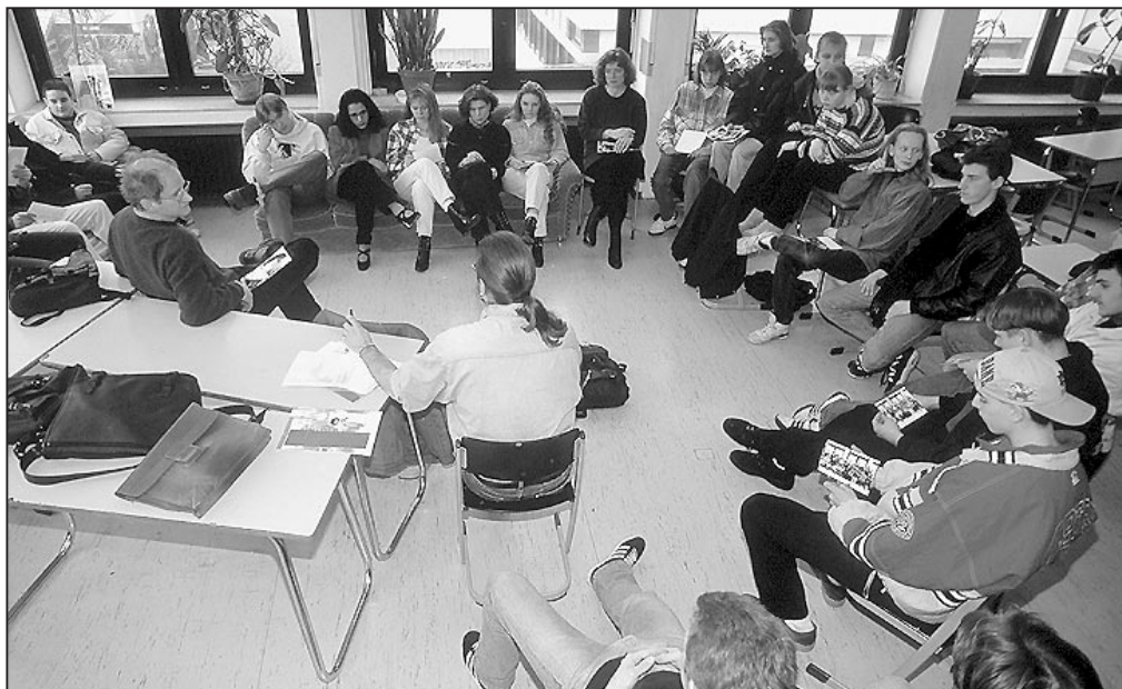
Die PISA-Studie hat gezeigt, dass integrierte Schulsysteme gegliederten Systemen überlegen sind. Ein Ausbau des integrierten Schulsystems in Niedersachsen wäre die richtige Konsequenz.

Diese Bedenken haben nach wie vor ihre Relevanz. Ein scheinbar positives Testergebnis darf nicht die Grundlage dafür sein, diese Bedenken außer Acht zu lassen. Eine kritische Distanz zu den Untersuchungsergebnissen muss wieder deutlicher werden.