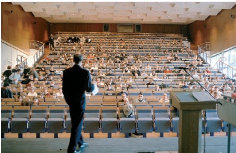
Vorlesung im Audimax. Die neuen Lehramtsstudiengänge sind ausnahmslos an Universitäten angesiedelt.