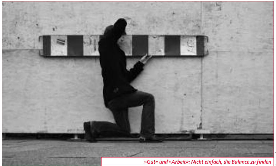
»Gut« und »Arbeit«: Nicht einfach, die Balance zu finden

Die Individualisierung von Problemen wird dieser Situation allerdings nicht gerecht – und auch nicht das von der EU propagierte Konzept der »Beschäftigungsfähigkeit«, nach dem jeder Arbeitnehmer für die eigene Qualifizierung persönlich Sorge zu tragen hat.