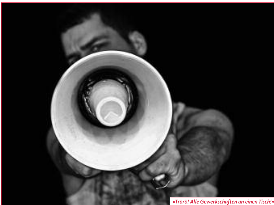
»Trörö! Alle Gewerkschaften an einen Tisch!«

Die Ausrichtung der Mitbestimmungspolitik und Tarifgestaltung steht fest: Die Arbeit der DGB-Jugend wird internationaler werden. 5